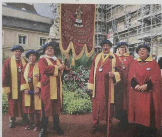
Parmi les nombreuses confréries qui ont pu défiler dans les rues de Melun samedi, les vignes de Saint-Fargeau étaient présentes. W L/RSM77